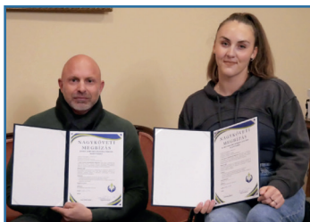
Szent Vincent Rehabilitációs Alapítvány